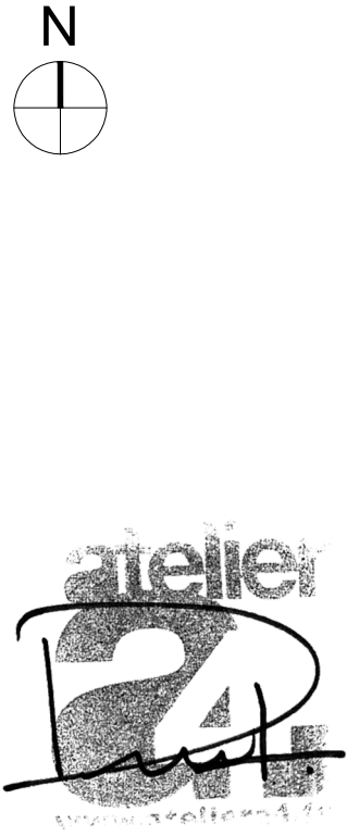
PLAN DE REPERAGE PHOTOGRAPHIES 1/2000eme